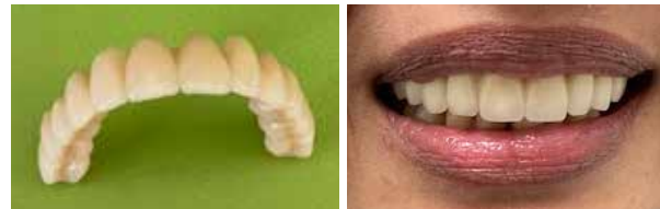
Ermöglicht natürliche Ästhetik