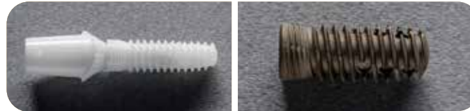
Zirkonspritzguß Implantissimo GmbH & biologic technologies GmbH & Co.KG Keramik-Coating auf Titan Implantissimo GmbH & biologic technologies GmbH & Co.KG

Gewinnen Sie eine Flugreise zum GreaterDental Meeting in New York, inkl. 5 Übernachtungen für 2 Personen im Gesamtwert von 4000,00 EUR. (Die Begleitperson bezahlt davor nur das Flugticket)