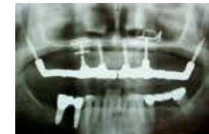
Trouble Shooting und schnelle Lösungen